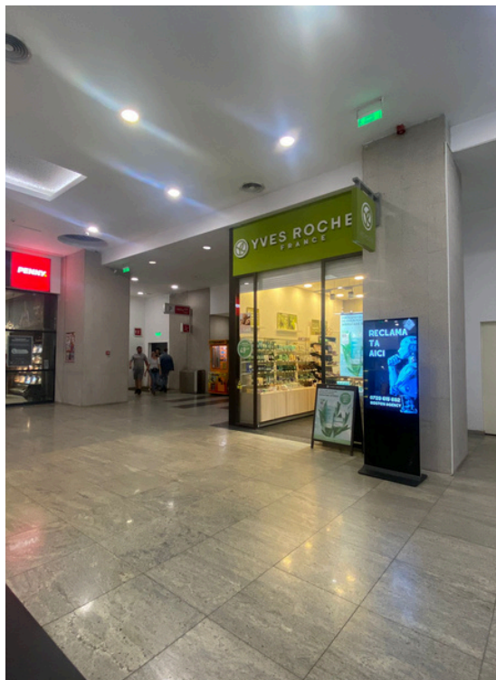
MAGAZIN PROFI ȘI YVES ROCHE